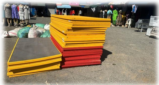
Spende der Kenya Judo Federation: neue Matten - eine große Wertschätzung unserer Arbeit!