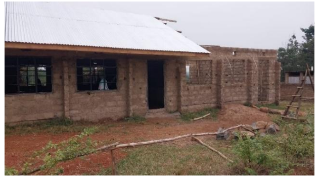
links: unser schöner Innenhof , rechts: Baufortschritt bei den neuen Klassenzimmern