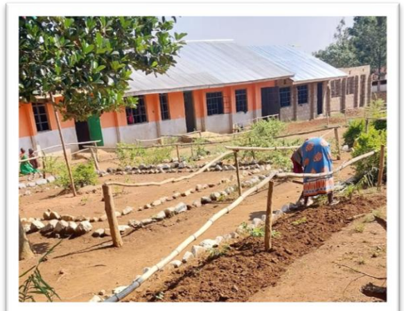
oben: einige Eltern helfen bei anfallenden Arbeiten an der GBA (anstatt Schulgebühren zu bezahlen)