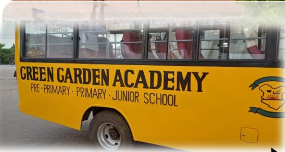
Schulbus und Judo-Raum im neuen Anstrich