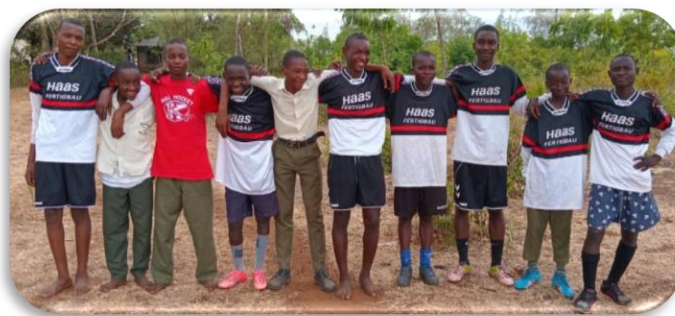
Fußballteam der GGA