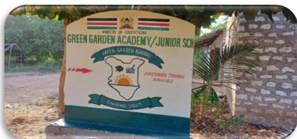
neuer Wegweiser für die GGA