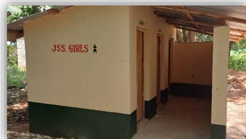
neue Toiletten für die JSS