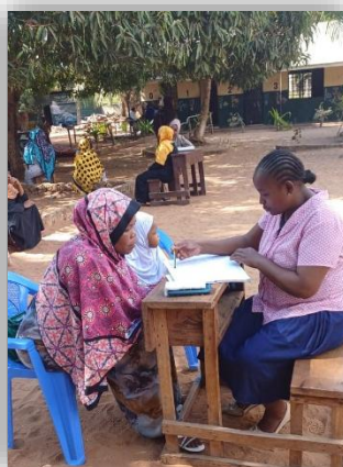
Lernerfolgsgespräche mit Eltern