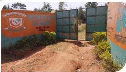
ein neues Eingangstor für die GBA