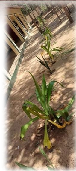
unsere Green Garden Academy