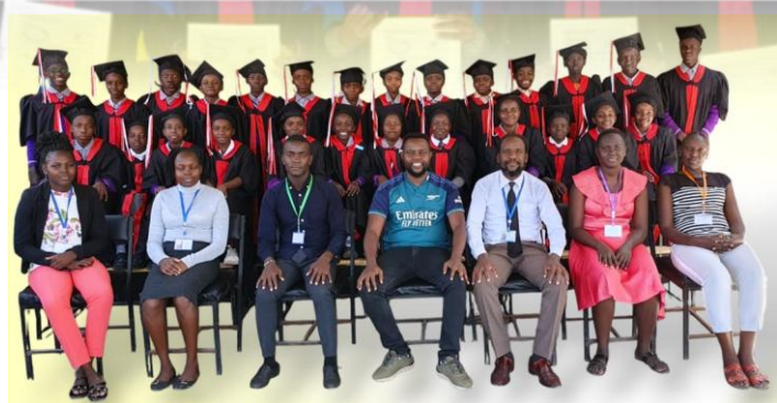
Grade 7 Abschluss

Sport gehört natürlich auch zum Schulalltag.