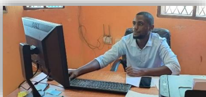
Innocent verstärkt unser Administrationsteam.